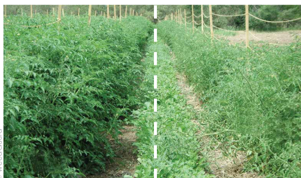
Avec le paillage 100% biodégradable