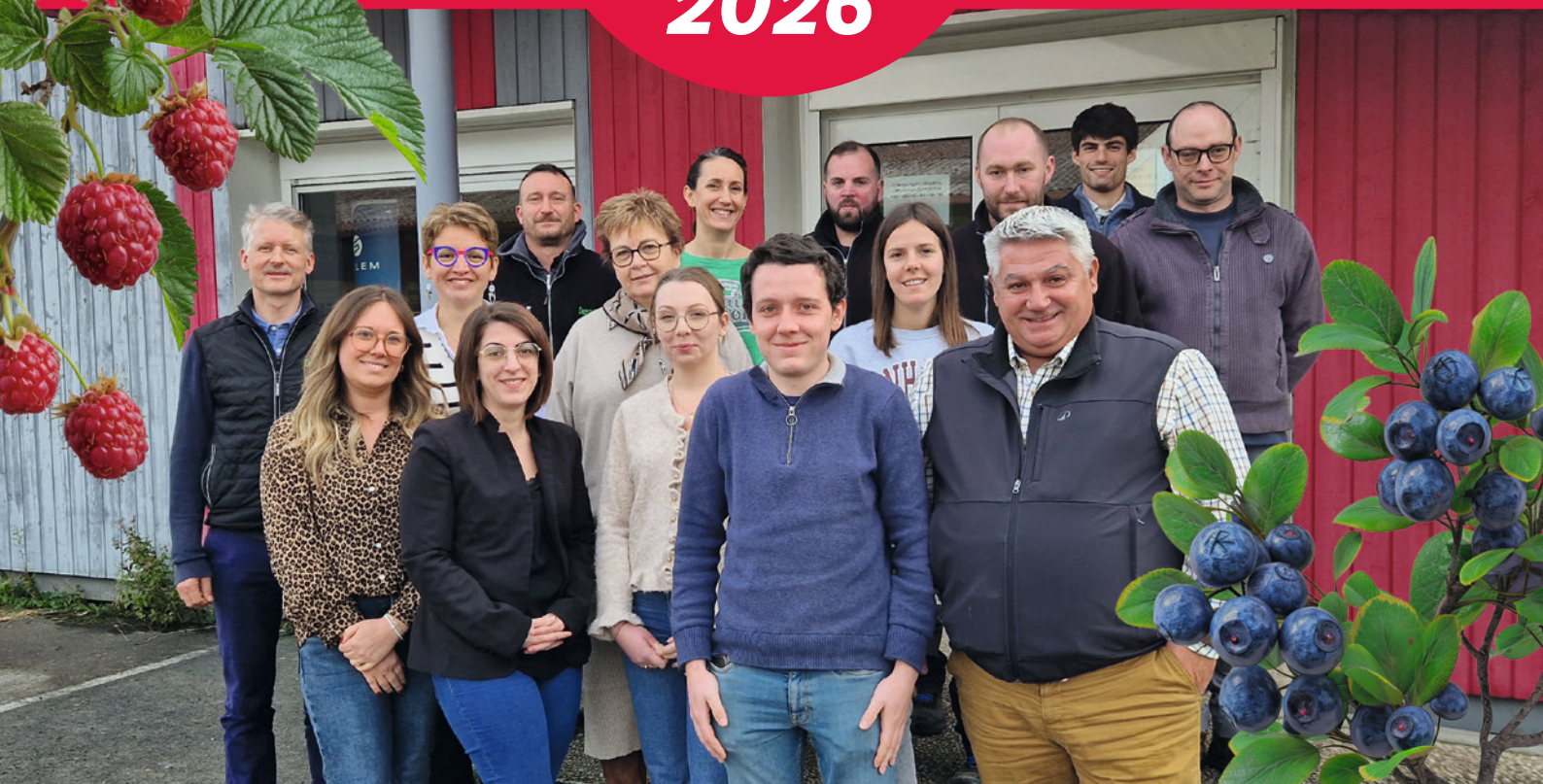
L'équipe Degrav'Agri réunie.