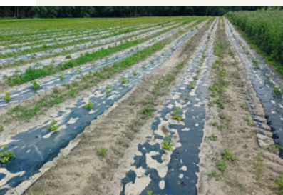
Pépinières framboisiers juin 2024

Une exigence d'excellence au quotidien pour votre réussite.